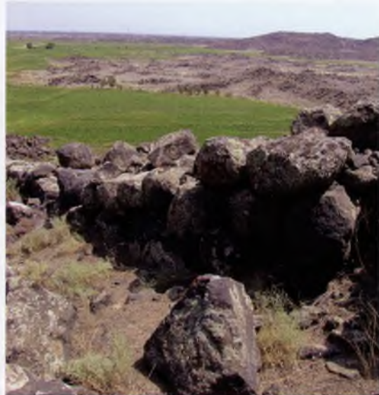
Karakoyunlu Kalesi, aşağıda Iğdır Ovası/ Aras Vadisi.