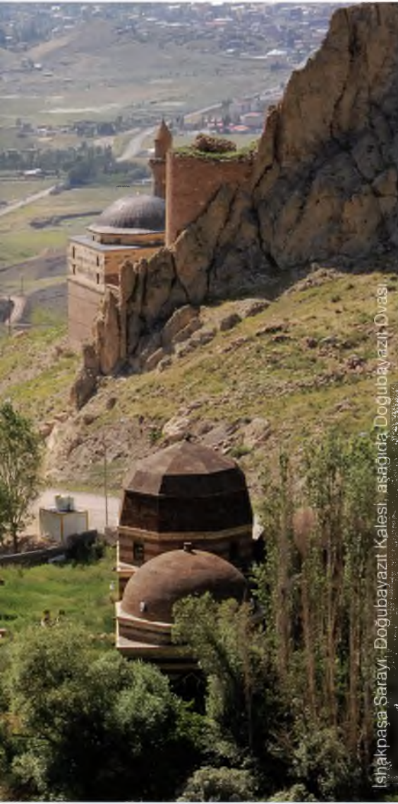
İshakpaşa Sarayı, Doğubayazıt Kalesi, aşağıda Doğubayazıt Ovası.

başlayarak Akhaimenid dönemini de içine alarak Ağrı Dağı'nın eteklerindeki lav tepeleri üzerinde ve uzantısı olan bu ovadaki höyüklerde neredeyse aralıksız sıralanmıştır. Sürmeli Çukur olarak da adlandırılan Aras Vadisi, Önyasya'nın en yüksek volkanları olan Aragats/Alagöz Dağı ve Ağrı Dağı arasından akan Aras Nehri düzlüğüdür. Transkafkasya'nın Kuradan sonra en büyük nehri olan Aras, ülkemizin doğusunda Ermenistan, Nahçıvan ve İran'la uzun bir sınır oluşturur; vadinin ülkemiz sınırları içindeki kısmı Iğdır Ovası, karşıda Ermenistan içinde yer alan bölümü de Ararat Ovası olarak isimlendirilir.